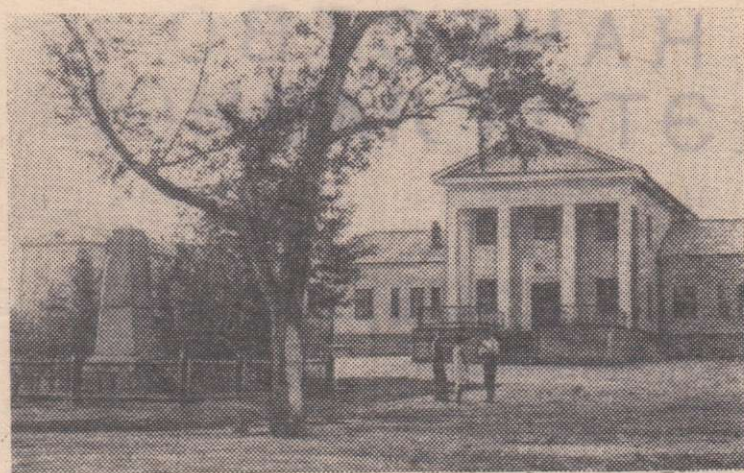
В Чебаркульском совхозе Челябинской области построен клуб (на снимке). В нем зрительный зал на 250 мест, комната отдыха, библиотека, комнаты для занятий кружков художественной самодеятельности.